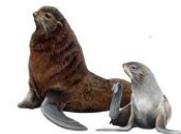
Северный морской котик

5. Какие из этих животных занесены в Красную книгу России?